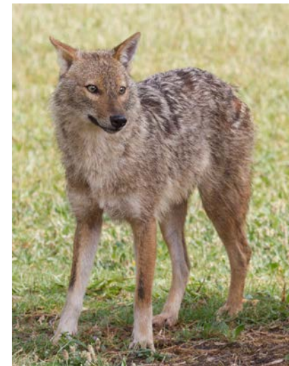
Шакал звичайний Canis aureus L. тварина 2018

Міністерство освіти і науки України Ужгородський національний університет Зоологічний музей