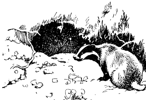
Борсук — типовий троглофіл. Рисунок за: О. Корнєєвим (1967).